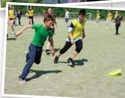
A game of Bench Frisbee