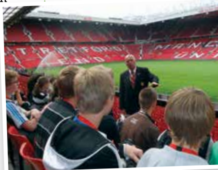
Manchester United Football Club