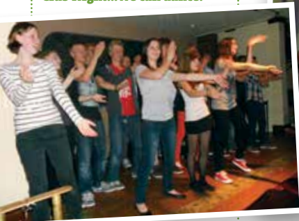
Club Night...We can dance!