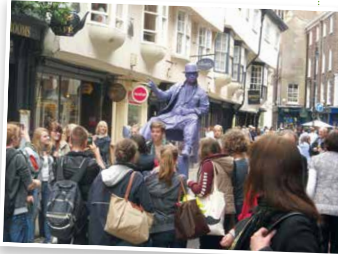
York's old streets with eccentric Englishman!

Unsere 'Embrace England Sprachferien' wurden ins Leben gerufen, um Schüler zu einem ein- oder zweijährigen Aufenthalt an der Huntington School in York zu inspirieren. Die Teilnahme an den Sprachferien steht jedoch allen Schülern offen, die ihr Englisch verbessern und die Kultur Englands kennenlernen möchten, ohne jegliche Verpflichtung sich für einen längeren Studienaufenthalt bewerben zu müssen. Obwohl unsere Sprachreise KEINE Vorbedingung für ein Schuljahr an der Huntington School ist, sind die Vorteile eines solchen Aufenthalts in den Ferien beachtlich. Denn eine Embrace England Sprachreise gibt Schülern neben der offensichtlichen sprachlichen Förderung, auch die Gelegenheit York kennenzulernen, für einige Zeit in einer englischen Gastfamilie zu wohnen und die Huntington School zu besuchen.